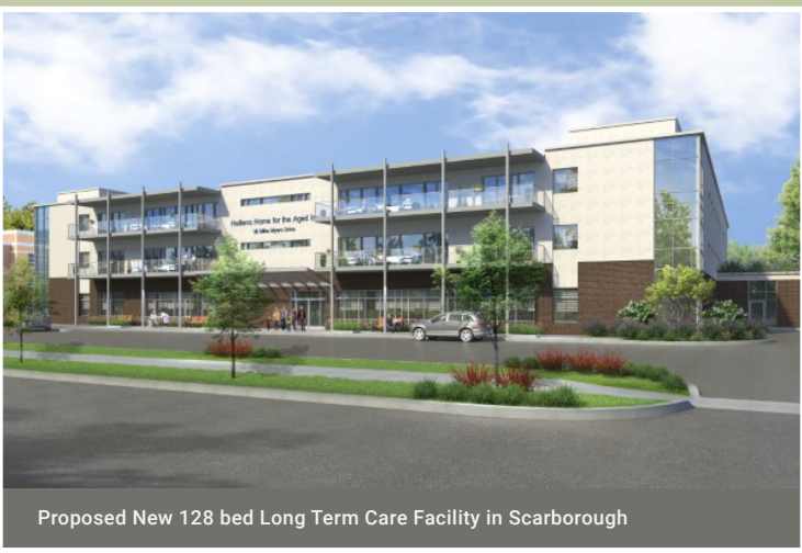
Proposed New 128 bed Long Term Care Facility in Scarborough